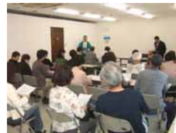
健康セミナーの様子

10月18日、19日に開催いたしました第3回創業祭には216組の方々にご来場いただき、盛大に行うことができました。これも皆様のお陰と感謝しています。ありがとうございました。これからも社員一同皆様のお役に立てる様がんばってまいります。