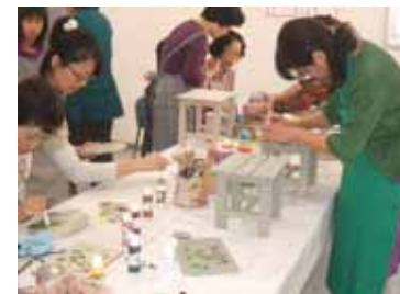
ステンシル教室の様子