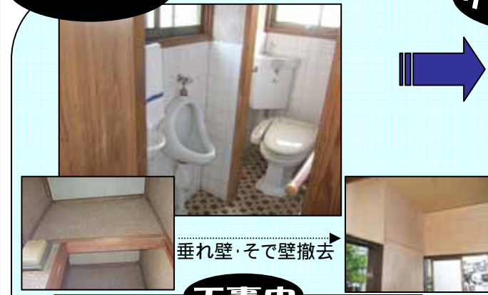
垂れ壁・そで壁撤去