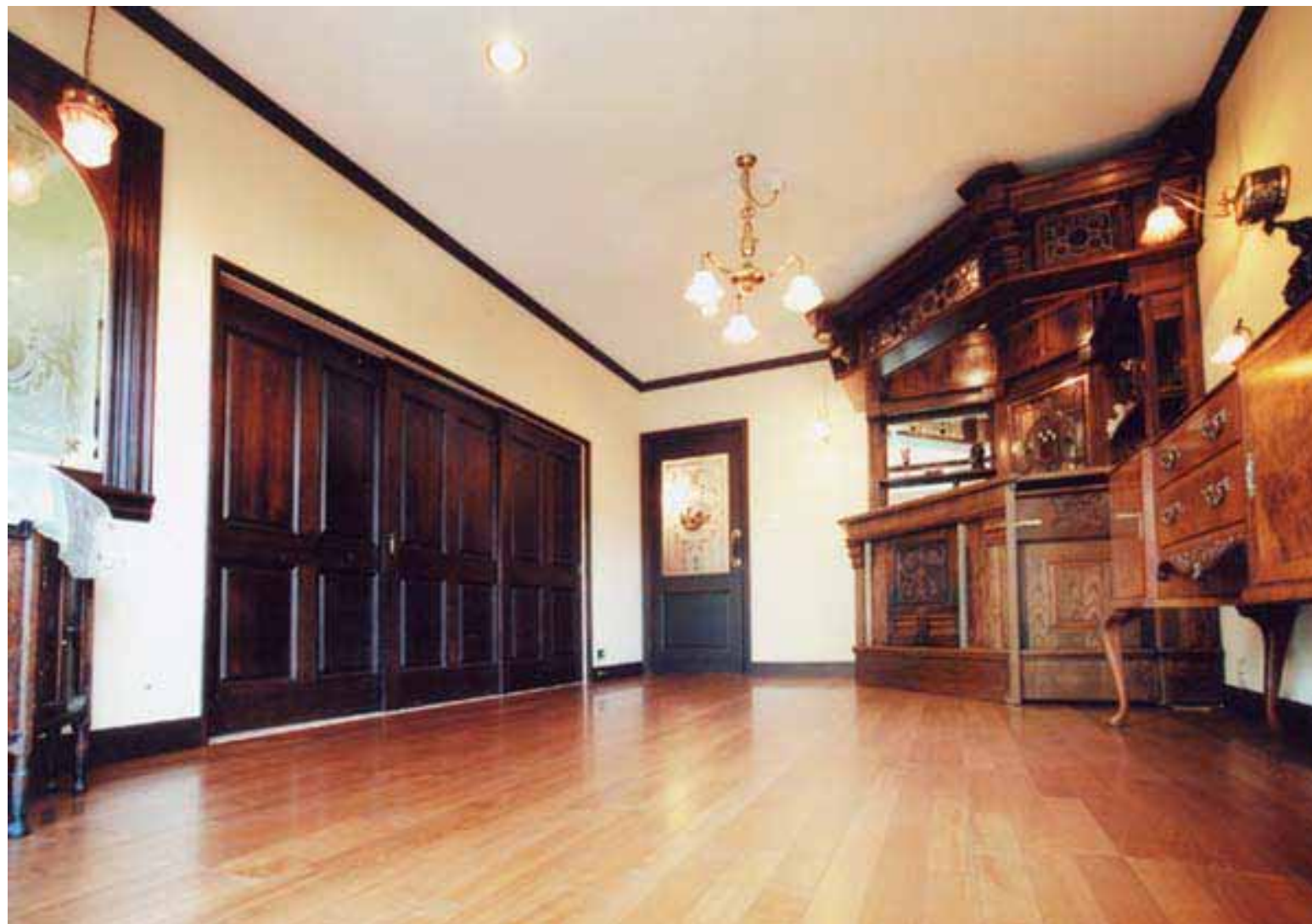
リフォーム後リビング

和室 増築部分に使用した桧の柱との違和感をなくすために、既存の枠に単板を貼った。